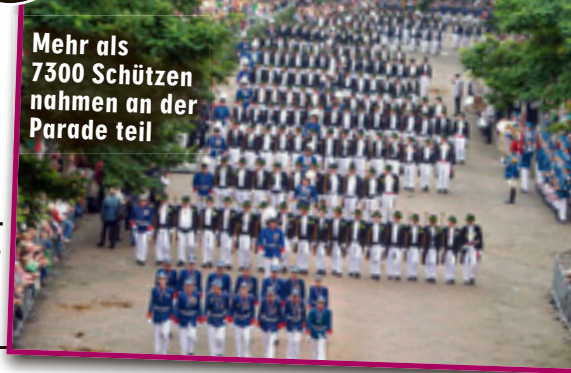
Mehr als 7300 Schützen nahmen an der Parade teil

Übrigens: Ans Rauchverbot im Rathaus hielt sich der „Vesuv“ eisern.