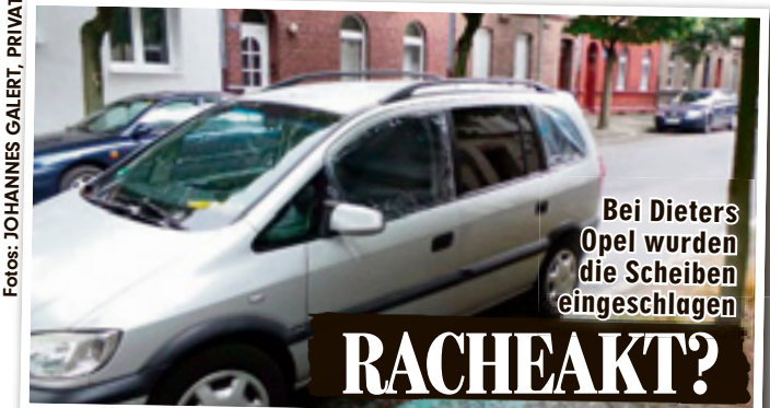
Bei Dieters Opel wurden die Scheiben eingeschlagen